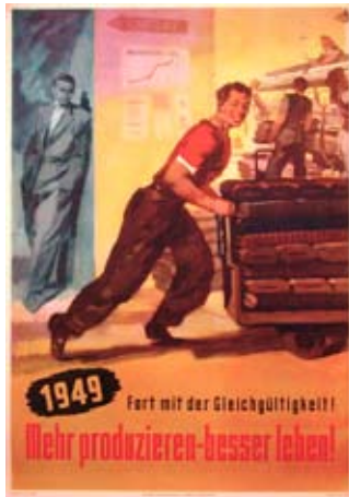
E 0775-1-95 Rahmenmaß: 84 x 59 cm (A1) Fort mit der Gleichgültigkeit! Mehr produzieren - besser leben! 1949, A 1