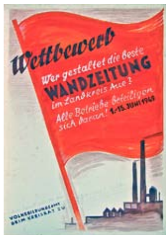
E 0195/86 Rahmenmaß: 80 x 60 cm Kurt Teubner Plakatentwurf Wandzeitungswettbewerb 1949, Landkreis Aue 1949, Tempera, Bleistift, Röteln, 61 x 43