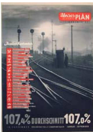
E 0757-95 Rahmenmaß: 84 x 59 cm (A1) Unser 2 Jahr - Plan / September 1949, A 1