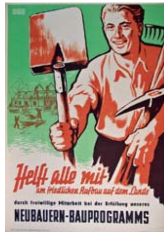
E 0740-1-95 Rahmenmaß: 84 x 59 cm (A1) DEWAG Helft alle mit am friedlichen Aufbau auf dem Lande 1951(?), Offsetdruck, 84 x 59