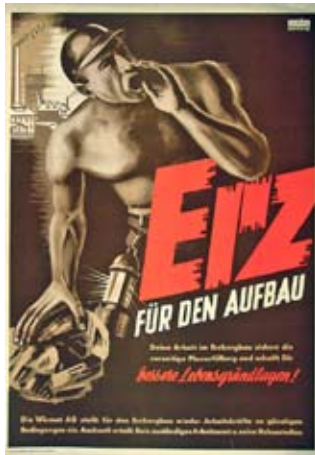
E 0790-95 Rahmenmaß: 100 x 70 cm DEWAG Erz für den Aufbau 1950 (?), Offsetdruck, 86 x 61