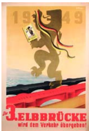
E 0803-95 Rahmenmaß: 84 x 59 cm (A1) Jo Brase Die 3. Elbbrücke wird dem Verkehr übergeben! 1949, A 1