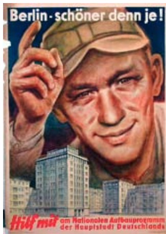
E 0861-95 Rahmenmaß: 84 x 59 cm (A1) Wilhelm Schubert-Hellerau Berlin - schöner denn je! 1952 (?), A 1