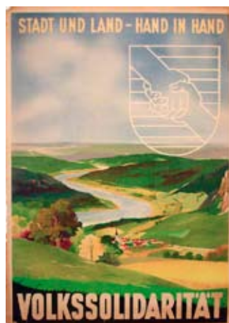
E 0731-1-95 Rahmenmaß: 84 x 59 cm (A1) Stadt und Land - Hand in Hand A 1