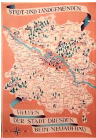
E 0778-95 Rahmenmaß: 84 x 59 cm (A1) Wolgram Stadt- und Landgemeinden helfen der Stadt Dresden beim Neuaufbau 1946 (?), A 1