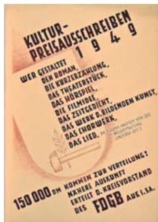
E 0194/86 Rahmenmaß: 80 x 60 cm Kurt Teubner Plakatentwurf Kulturpreisausschreiben des FDGB Aue 1949, Tempera, Bleistift, Röteln, 61 x 43