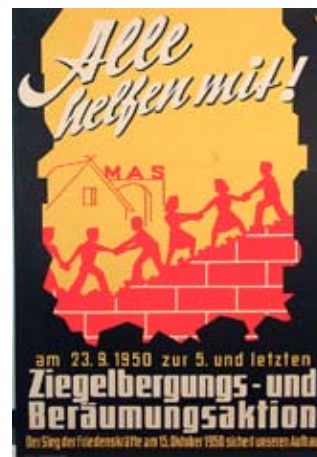
E 0826-95 Rahmenmaß: 84 x 59 cm (A1) K. Bernsdorf Alle helfen mit! Ziegelbergungs- und Beräumungsaktion 1950, A 1