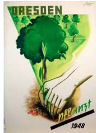
E 0800-95 Rahmenmaß: 84 x 59 cm (A1) Horst Naumann Dresden pflanzt 1948, A 1