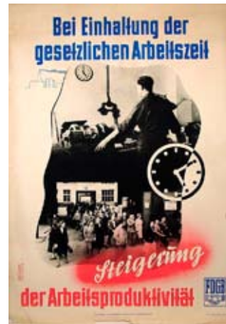
E 0785-1-95 Rahmenmaß: 84 x 59 cm (A1) Steigerung der Arbeitsproduktivität A 1