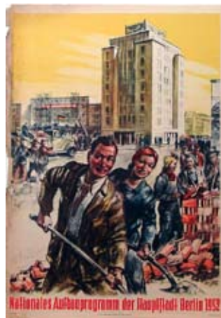
E 0668/95 Rahmenmaß: 80 x 60 cm Nationales Aufbauprogramm der Hauptstadt Berlin 1952 A 2