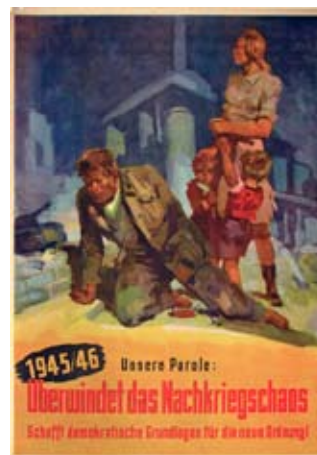
E 0772-95 Rahmenmaß: 84 x 59 cm (A1) Ahlery Überwindet das Nachkriegschaos 1945/46, Offsetdruck, 84 x 59,5