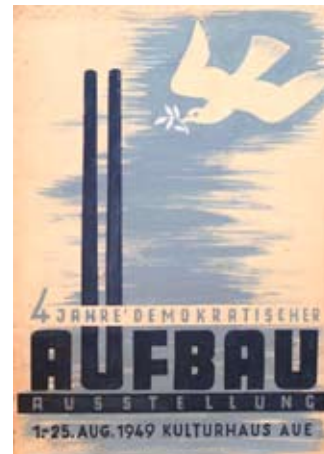
E 1380-11 Rahmenmaß: 80 x 60 cm Kurt Teubner 4 Jahre demokratischer Aufbau Aue 1949, Plakatentwurf, Tempera, 61 x 43