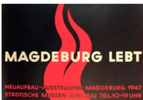
E 0730-2-95 Rahmenmaß: 59 x 84 cm (A1) Magdeburg lebt 1947, A 1