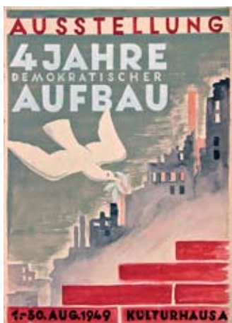
E 0193/86 Rahmenmaß: 80 x 60 cm Kurt Teubner Plakatentwurf Ausstellung 4 Jahre Demokratischer Aufbau 1949, Tempera, 60,5 x 43,5