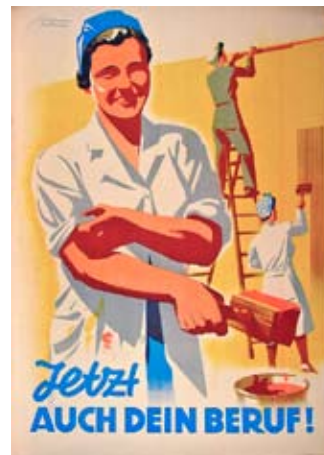
E 0779-95 Rahmenmaß: 84 x 59 cm (A1) Horst Naumann Jetzt auch Dein Beruf! 1946, Offsetdruck, 85 x 60,5