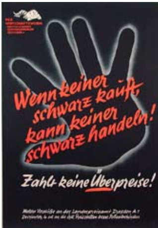
E 0842-95 Rahmenmaß: 84 x 59 cm (A1) Wenn keiner schwarz kauft... Zahlt keiner Überpreise! 1948 (?), A 1