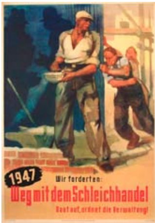
E 0773-95 Rahmenmaß: 84 x 59 cm (A1) Wir forderten: Weg mit dem Schleichhandel 1947, A 1