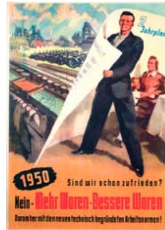
E 0776-95 Rahmenmaß: 84 x 59 cm (A1) Sind wir schon zufrieden? Mehr Ware - Bessere Ware 1950, A 1