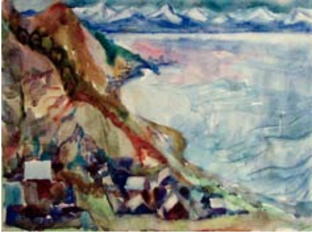
A 0219-78 Rahmenmaß: 60 x 80 cm Erika Klier, Fischerdorf am Baikalsee I, Aquarell, 35,5 x 48,0 cm