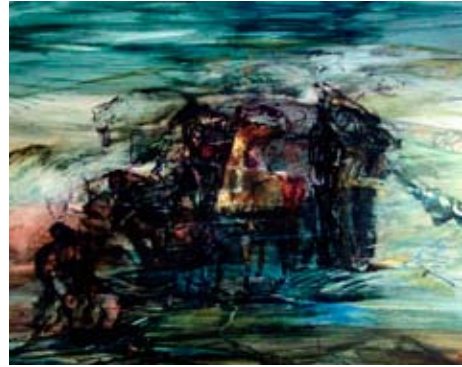
A 0429-84 Rahmenmaß: 60 x 70 cm Dagmar Ranft-Schinke, In der Steppe, 1980, Mischtechnik auf Karton, 38,6 x 48,0 cm