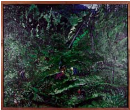
A 0252/79 Rahmenmaß: 115 x 100 cm G. W. Schichalew, In der Taiga, Öl auf Pappe, 94 x 80 cm