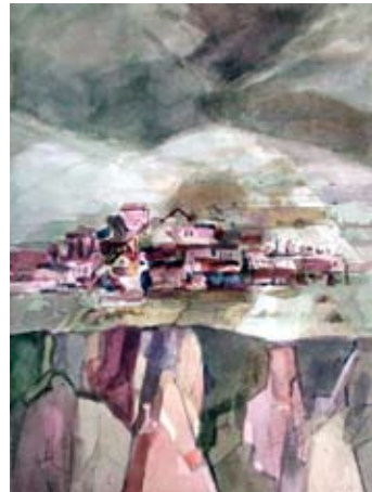
A 0493-85 Rahmenmaß: 90 x 70 cm Gerald Sippel, o. T. (Landschaft Kaukasus), 1984, Aquarell, 75,0 x 54,5 cm