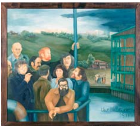
A 0173/77 Rahmenmaß: 120 x 145 cm Uwe Bullmann, Wolgaschiffsreise, 1977, Öl auf Hartfaser, 100 x 125 cm