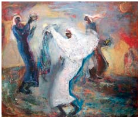
A 0142/77 Rahmenmaß: 120 x 140 cm Axel Wunsch, Arabischer Tanz, 1974, Mischtechnik auf Hartfaser, 101 x 121 cm