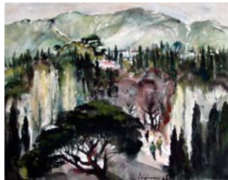
A 0816-90 Rahmenmaß: 50 x 70 cm Lutz Voigtmann, Jalta-Krim, 1985, Aquarell, 37,5 x 47,5 cm