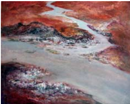
A 0043-75 Rahmenmaß: 80 x 95 cm Lutz Voigtmann, Flugbild Angara, 1974, Mischtechnik auf Karton, 59 x 73 cm