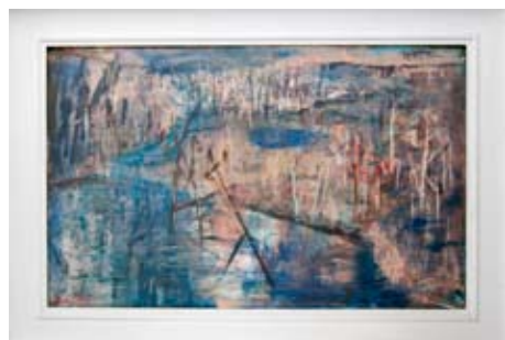
A 0146/77 Rahmenmaß: 80 x 110 cm Axel Wunsch, Taigalandschaft, 1973, Mischtechnik auf Hartfaser, 58 x 92,5 cm