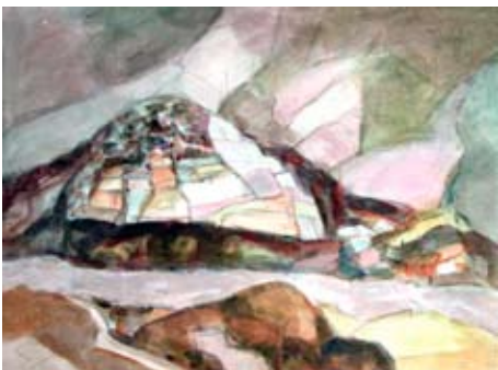
A 0491-85 Rahmenmaß: 70 x 90 cm Gerald Sippel, o. T. (Landschaft Kaukasus), 1984, Aquarell, 55,0 x 75,0 cm