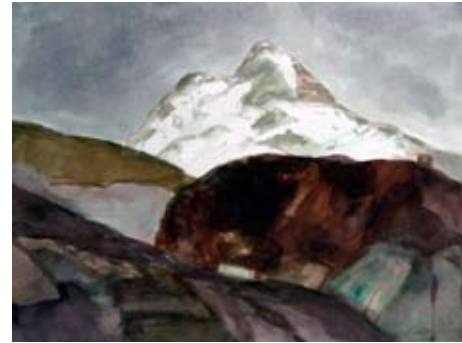
A 0492-85 Rahmenmaß: 70 x 90 cm Gerald Sippel, o. T. (Gebirge/Ararat), 1984, Aquarell, 55,0 x 75,0 cm