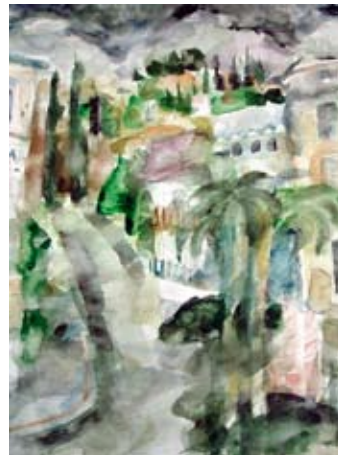
A 0844-93 Rahmenmaß: 80 x 60 cm Fritz Diederling, Gasse in Jalta, 1985, Aquarell, 65,0 x 48,5 cm