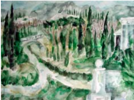
A 0841-93 Rahmenmaß: 70 x 90 cm Fritz Diederling, Park auf der Krim, 1984, Aquarell, 48,0 x 65,0 cm