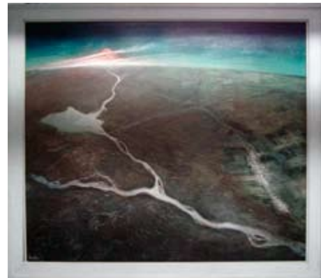
A 0172/77 Rahmenmaß: 133,5 x 155 cm Lutz Voigtmann, Flugbild Kasachstan - Sonnenaufgang über d. Steppe, 1977, Öl auf Hartfaser, 120 x 140 cm