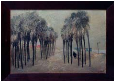
A 0126/76 Rahmenmaß: 58 x 79 cm Lutz Voigtmann, Am Strand von Batumi, 1976, Öl auf Hartfaser, 43,5 x 65 cm