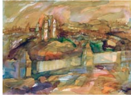
A 0318-80 Rahmenmaß: 60 x 80 cm Gerald Sippel, Kremlmauer, 1975, Mischtechnik auf Karton, 35,7 x 47,7 cm