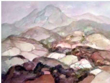
A 0494-85 Rahmenmaß: 70 x 90 cm Gerald Sippel, o. T. (Berge Kaukasus), 1984, Aquarell, 55,0 x 74,5 cm