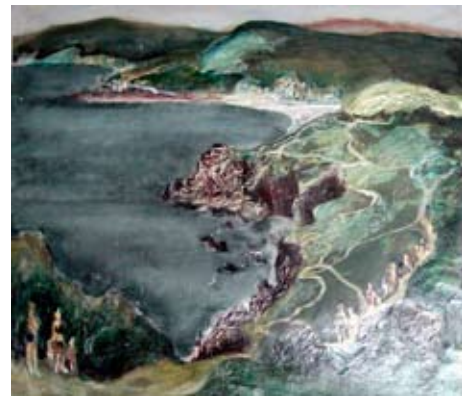
A 0073-75 Rahmenmaß: 70 x 80 cm Lutz Voigtmann, Steilküste bei Arkutino, 1972, Mischtechnik auf Karton, 49,5 x 57,7 cm