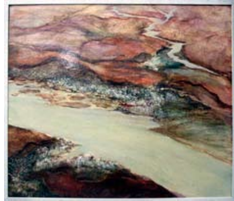
A 0215/78 Rahmenmaß: 125,5 x 143 cm Lutz Voigtmann, Flugbild Irkutsk, 1973, Öl auf Hartfaser, 122,5 x 139 cm