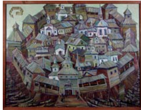
A 0251/79 Rahmenmaß: 72,5 x 92 cm N. F. Schifkow, Festung Irkutsk, Öl auf Leinwand, 70 x 90 cm