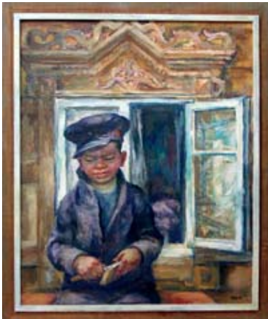
A 0853/95 Rahmenmaß: 117 x 98 cm Edgar Klier, Junge aus Bratsk, 1983, Öl auf Hartfaser, 107 x 88 cm