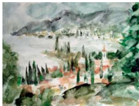
A 0839-93 Rahmenmaß: 70 x 90 cm Fritz Diederling, Blick auf Jalta, 1984, Aquarell, 48,5 x 64,5 cm